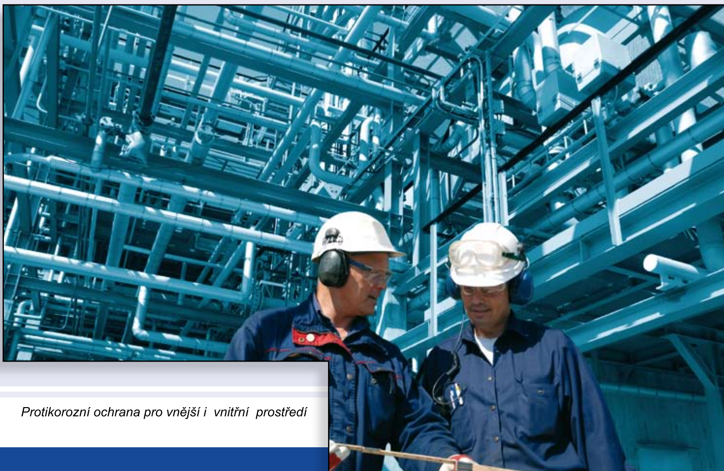
Protikorozi ochrana pro vnější i vnitřní prostředí