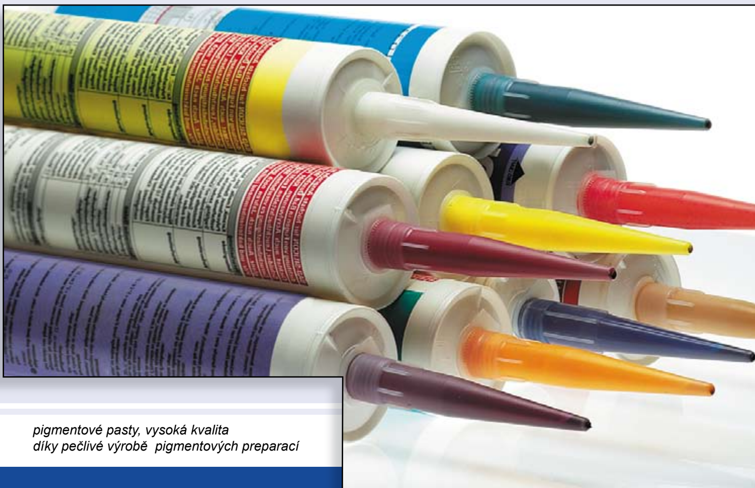
pigmentové pasty, vysoká kvalita díky pečlivé výrobě pigmentových preparací