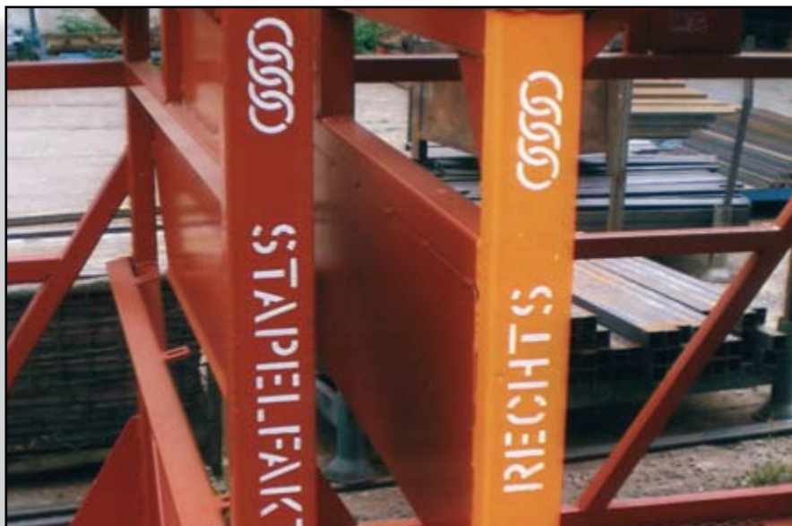
Nejvyšší možné know-how v protikorozi ochraně

cky, vysokotlakem, stříkáním zahorka atd.), máčením, navalováním nebo natíráním štětcem.